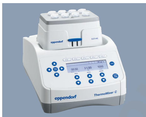
Agitation et thermostatisation parfaites avec le Eppendorf ThermoMixer C