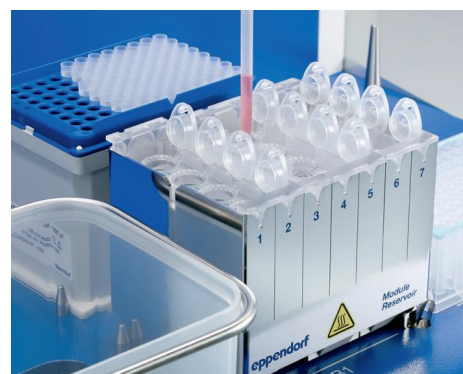
Intégration optimale dans le système de pipetage automatisé epMotion