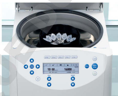
Centrifugation en toute sécurité avec les centrifugeuses Eppendorf