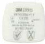
D7915 P1 R