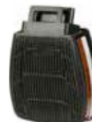
D8095 A2P3 R