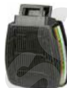
D8094 ABEK3 R