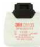
D3135 P3 R