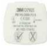
D7925 P2 R