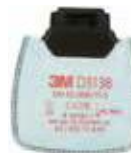
D3138 P3 R/Contre les odeurs gênantes de vapeurs organiques et gaz acides