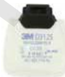
D3125 P2 R