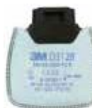
D3128 P2 R/Contre les odeurs gênantes de vapeurs organiques et gaz acides