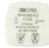
D7935 P3 R