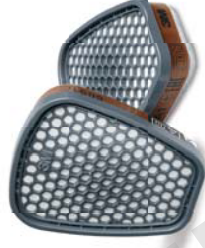
Filtre antigaz & vapeurs 3M™ 6051i

Aide les utilisateurs à déterminer quand changer leurs filtres dans des environnements appropriés ou peut être utilisé pour compléter un programme actuel de changement de filtre.