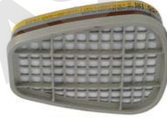
Filtre antigaz & vapeurs 3M™ 6051i

Peut être utilisé avec tous les demi-masques et masques complets avec ou sans filtres contre les particules.