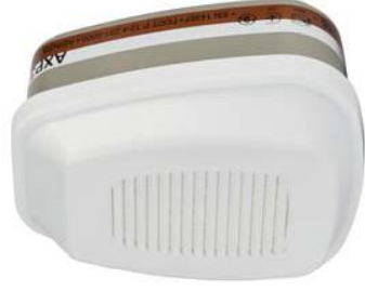
Filtre combiné 3M™ 6098

Ainsi que les classifications des filtres 6096 et 6099 qui ont été étendues pour couvrir des contaminants supplémentaires.