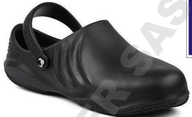
SUE021 Nero (36-46)

Le più leggere del mercato con un puntale resistente a 200 J (1500 kg) The lightest shoes on the market with toecap resistant to 200 J (1500 kg)