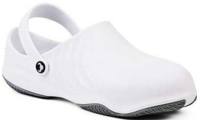
SUE020 Bianco (36-46)