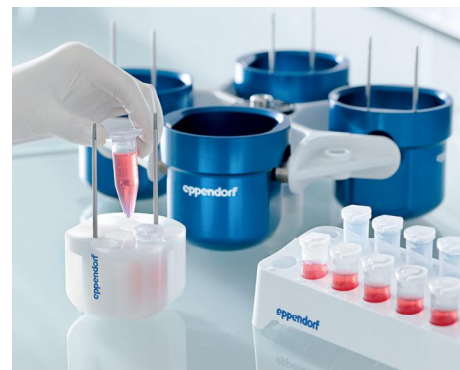
Adaptateurs optimisés pour les rotors libres existants