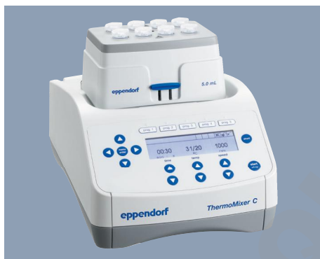
Agitation et thermostatisation parfaites avec le Eppendorf ThermoMixer C