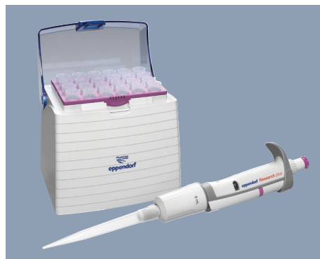
Avec les pipettes et pointes epT.I.P.S.® Eppendorf, 5,0 mL, un pipetage exact en une seule étape