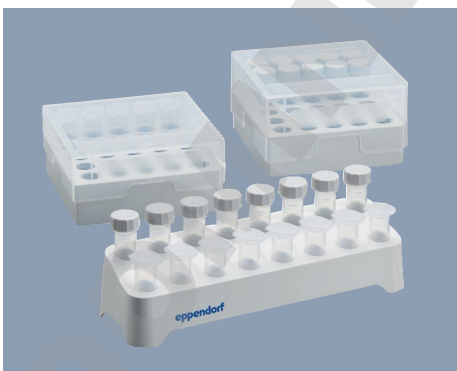
Nouveaux portoirs empilables, esthétiques et boîtes de stockage résistantes au froid