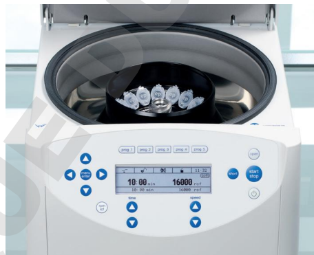
Centrifugation en toute sécurité avec les centrifugeuses Eppendorf