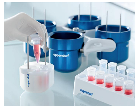
Adaptateurs optimisés pour les rotors libres existants