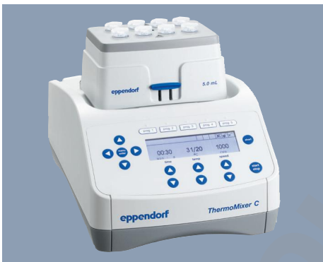
Agitation et thermostatisation parfaites avec le Eppendorf ThermoMixer C