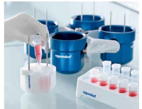
Adaptateurs optimisés pour les rotors libres existants