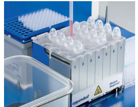
Intégration optimale dans le système de pipetage automatique epMotion