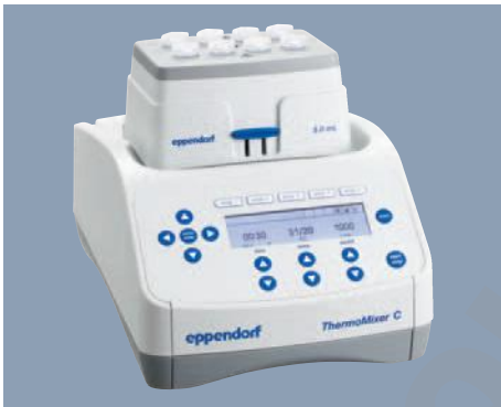
Agitation et thermostatisation parfaites avec le Eppendorf ThermoMixer C