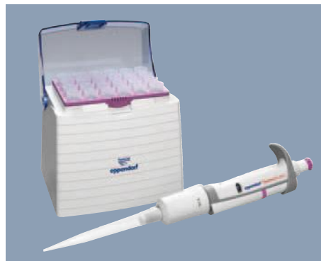
Avec les pipettes et pointes epT.I.P.S. Eppendorf 5,0 mL, un pipetage exact en une seule étape