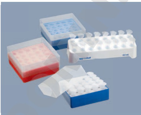
Nouveaux portoires empilables, esthétiques et boîtes de stockage résistantes au froid