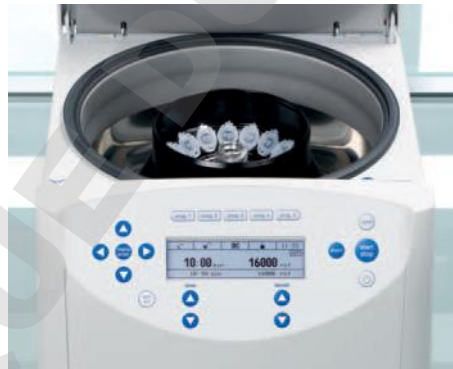
Centrifugation en toute sécurité avec les centrifugeuses Eppendorf