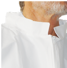
Col mandarin doublé