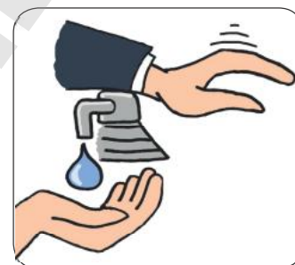
Action avec l'avant bras