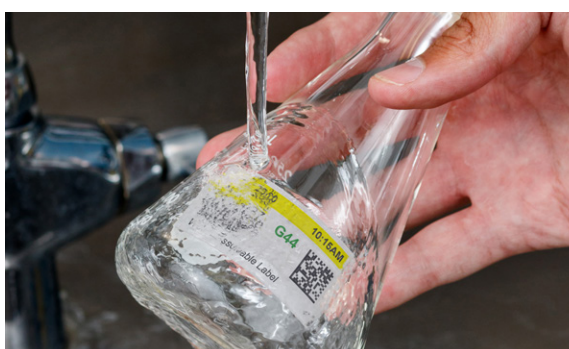
Etiquette temporaire B-403 soluble dans l'eau