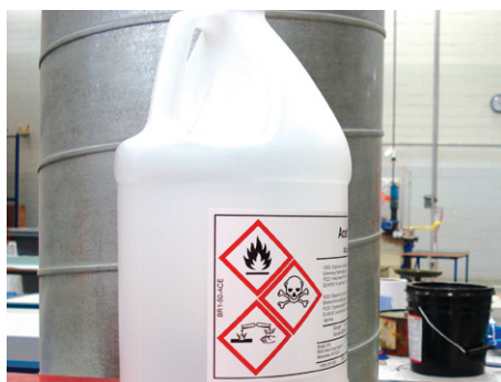
Bidons de produits d'entretiens