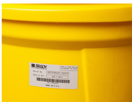
Identification & traçabilité des équipements