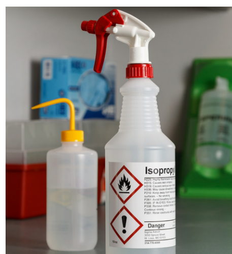
Pipettes et sprays vaporisateurs