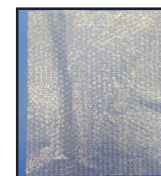
papier bulle 30 x 40 cm