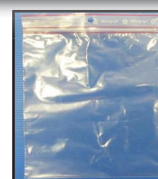
bag minigrip 180 x 280 mm