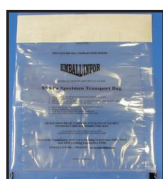
bag 95 KPa - Type A5