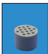
porte tube en mousse 14 trous