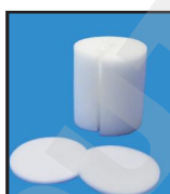
kit 3 mousses