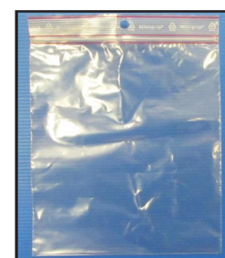
bag minigrip 180 x 280 mm