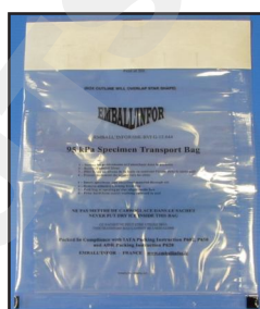
bag 95 KPa - Type A5