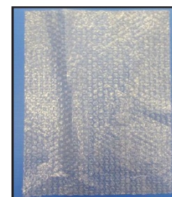
papier bulle 30 x 40 cm