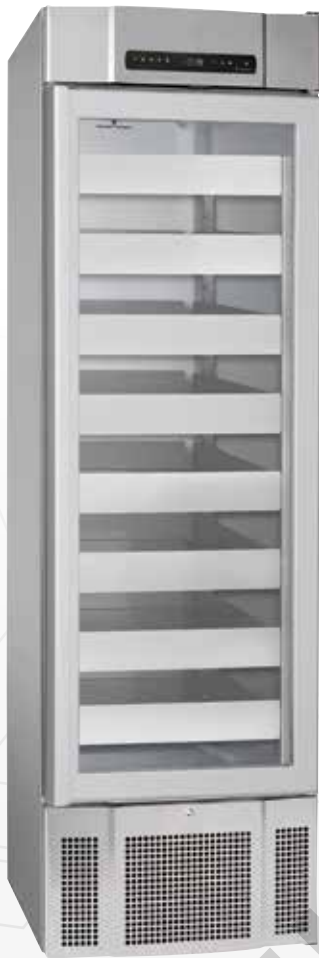
BioMidi EF425 Tiroirs en en options

L'armoire BioMidi 425 est une série de réfrigérateurs et de congélateurs conçue pour répondre à la plupart des exigences de stockage de biomatériaux avec très peu de restriction.