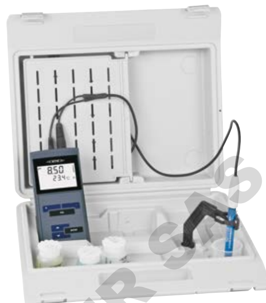
Set en mallette

Pour de plus amples informations, veuillez commander gratuitement notre catalogue "Laboratoire et Terrain Instrumentation" ou visiter notre internet: www.wtw.de/fr/produits/laboratoire (Pour plus de facilité vous pouvez aussi utiliser le QR code).