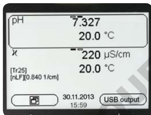
Affichage avec deux valeurs mesurées