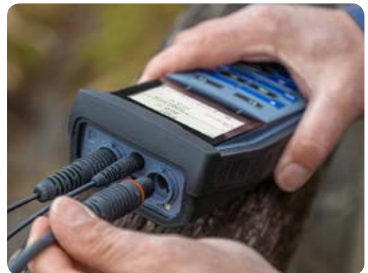
Interface USB étanche pour un transfert rapide des données

Prise étanche pour mesure sur le terrain