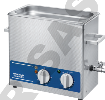
RK 255 H