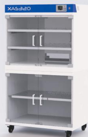
2 Meuble rehausseur

Surélève l'armoire pour un meilleur confort de chargement. Roulettes pivotantes avec freins. Étagère en supplément.