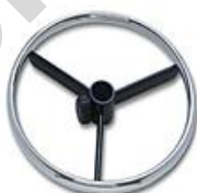
Acier chromé - Diamètre 44cm Code RPTL à ajouter en fin de réf.