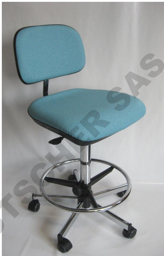
Visuel du siège 23 avec repose-pieds RPTL

Composition : PVC 85% Coton/PES 15% Classement non feu : M1 / test selon normes NFP 92503 et EN1021-1-2. Résistance à l'abrasion : 150 000 cycles Martindale Tenue à la lumière : >6 Absence de phtalates / Test selon norme NF EN 15777 Efficacité contre les bactéries (MRSA) : traitement qui combine différents agents bactéricides et fongicides (certificat Sanitized)