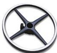
Aluminium poli - Diamètre 46cm Code RP à ajouter en fin de réf.