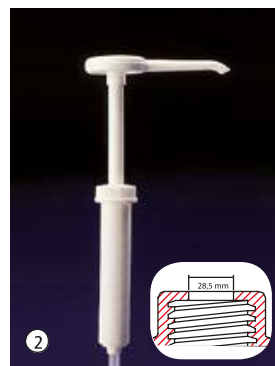
Dosi-Pump 30 ml Dosage standard env. 30 ml par pression.