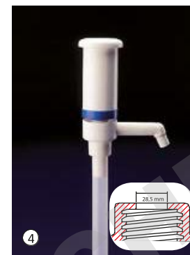
Dosi-Pump 100 ml, sortie fixe Dosage standard env. 100 ml par pression, la pompe dispose d'une sortie fixe.