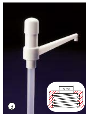
Dosi-Pump 30 ml, sortie fixe Dosage standard env. 30 ml par pression, la pompe dispose d'une sortie fixe.