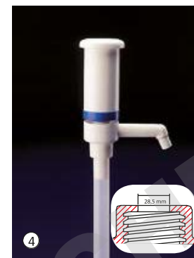
Dosi-Pump 100 ml, sortie fixe Dosage standard env. 100 ml par pression, la pompe dispose d'une sortie fixe.