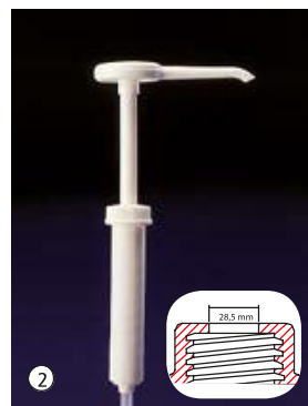
Dosi-Pump 30 ml Dosage standard env. 30 ml par pression.