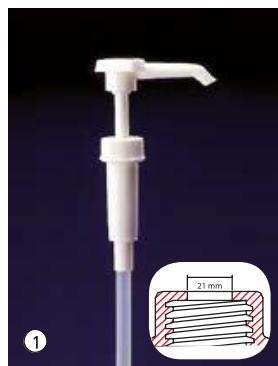
Dosi-Pump 4 ml Dosage standard env. 4 ml par pression.