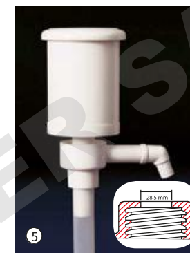
Dosi-Pump 250 ml, sortie fixe Dosage standard env. 250 ml par pression, la pompe dispose d'une sortie fixe.

Pompes de dosage adaptées aux fûts, bidons, ballons ou flacons, permettant de doser des liquides à viscosité variée.