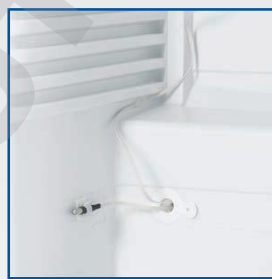
Passage cuve Ø 15 mm pour sonde GTC (Gestion Température Centralisée) - PT100 ou numérique.