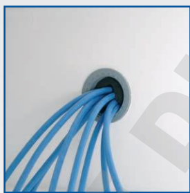
Passage de cuve diamètre 30 mm pour caractérisation et qualification sur site. Positionné sur le côté droit à 1/3 du haut.