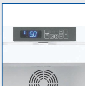
Régulation électronique Comfort (voir détail)