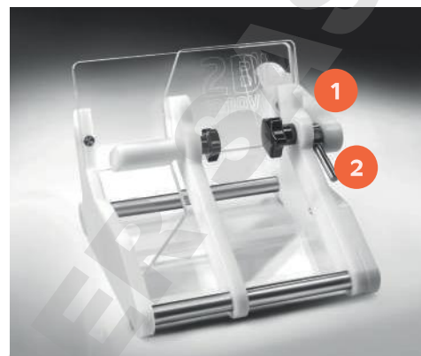
Portoir de sac 250 ml