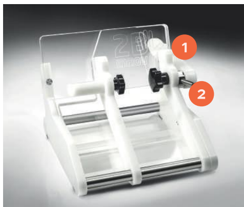
Portoir de sac 100 ml