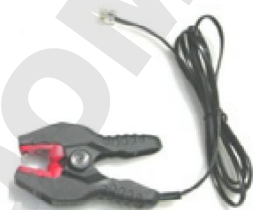
PINCE DE LECTURE

Vos IBees peuvent être lus et programmés avec les logiciels Thermotrack (PC, Online, Webservice) grâce à la pince de lecture et son adaptateur USB