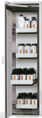
Armoire de sécurité S-CLASSIC-90 Modèle S90.196.060.WDAS Porte à charnières gauche gris clair (RAL 7035), avec système de maintien de porte et 4 tiroirs (en acier revêtement époxy) Code article 30228-001-30267