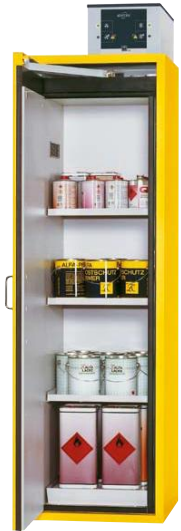
Armoire de sécurité S-CLASSIC-90 Modèle S90.196.060 Jaune sécurité (RAL 1004), porte à charnières gauche avec 3 étagères, cailllebotis et bac de rétention au sol (en acier revêtement époxy), caisson de ventilation avec filtration intégrée en option Code article 30227-002-30249