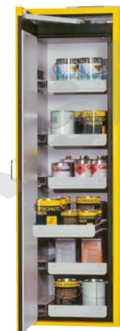
Armoire de sécurité S-CLASSIC-90 Modèle S90.196.060.WDAS Jaune sécurité pour porte à charnières gauche (RAL 1004), avec système de maintien de porte et 6 tiroirs (en acier revêtement époxy) Code article 30228-002-30269