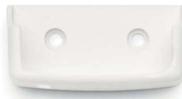
HI144002 station d'accueil USB fournie avec HI144-10