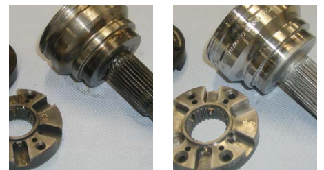
Élimination des oxydations et autres encrassements