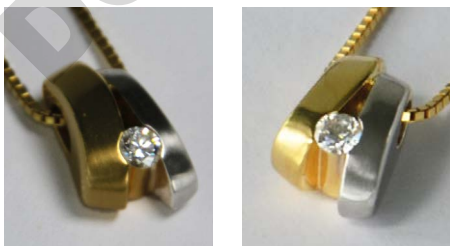
Élimination de pâtes de polissage