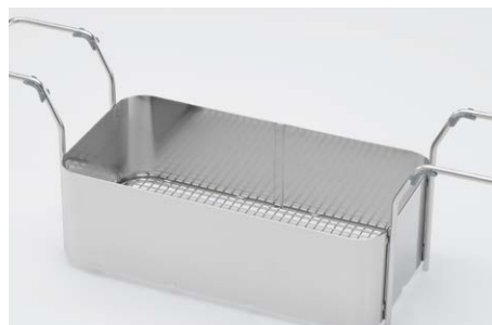
Paniers en acier inoxydable