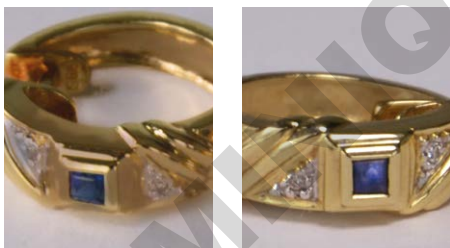
Élimination des impuretés