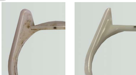
Élimination de pâtes de polissage