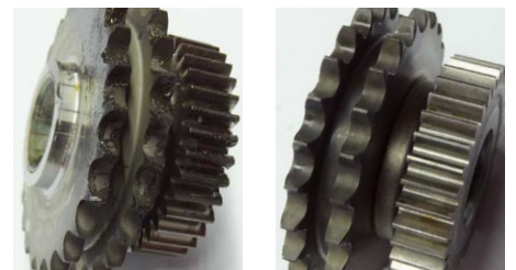
Nettoyage de graisse et de silicone