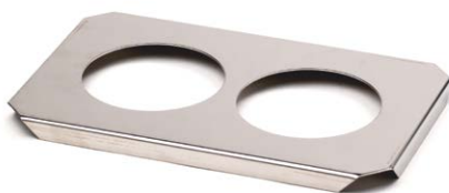
Couvercle perforé pour l'application de flacons