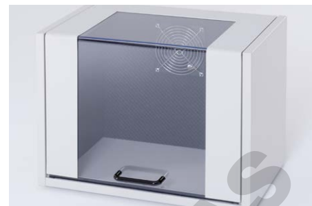
Boîtier de protection sonore