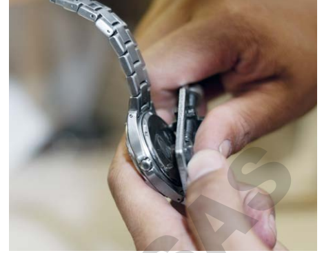
Nettoyage de pièces d'horlogerie comme les montres, les boîtiers, etc.

Les appareils à ultrasons Elmasonic xtra TT sont conçus pour l'application dans la production, les ateliers et le service. Les équipements comme la fonction Sweep durablement intégrée, la fonction Dynamic individuelle ou la température seuil réglable individuellement avec voyant d'avertissement à LED, facilitent le nettoyage des pièces au quotidien.