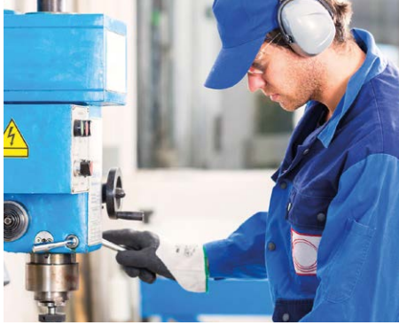
Nettoyage industriel de pièces par ex. des pièces de moteur, de filtres, etc.

Appareils de table robustes pour les applications à ultrasons à haut débit