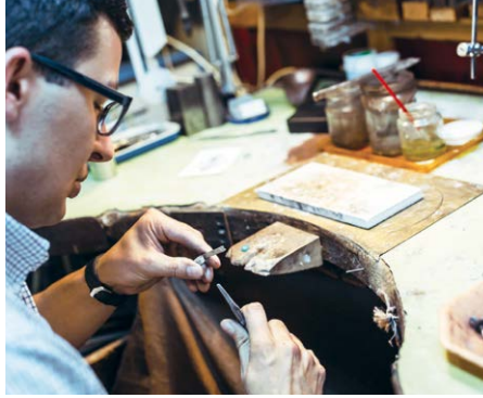
Nettoyage de bagues, de colliers, de boucles d'oreilles, etc.