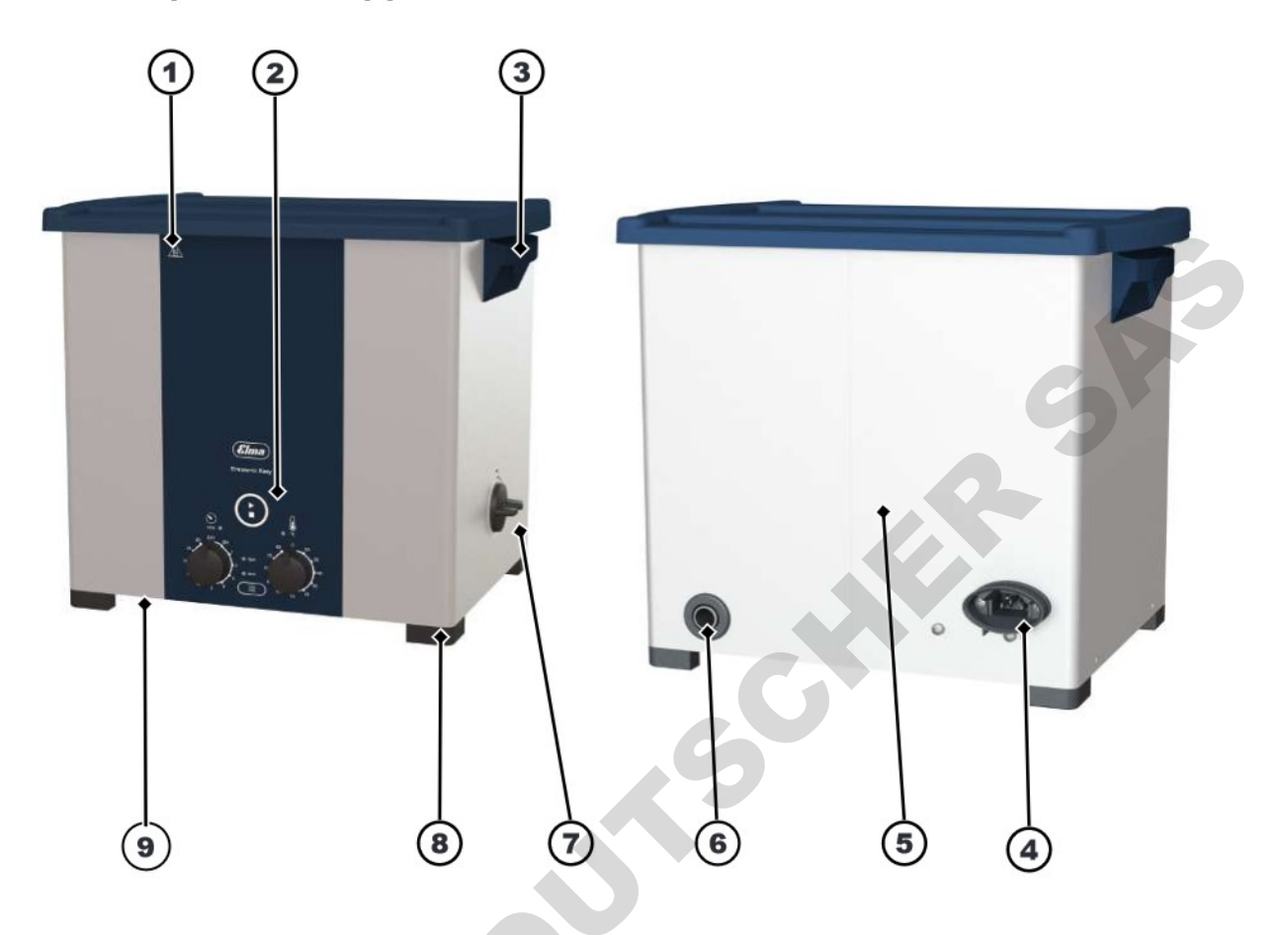
Fig. 2: Côté commande/face arrière