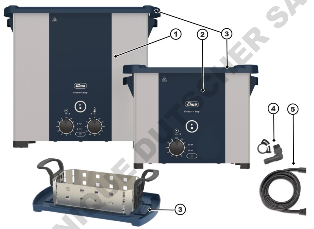
Fig. 1: Étendue de la livraison

Éliminer les matériaux d'emballage qui ne sont plus nécessaires de manière à respecter l'environnement.