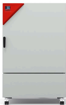
Modèle KB ECO 240