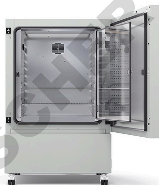
Modèle KB ECO 240