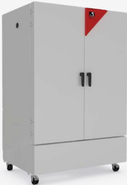
Modèle KB ECO 1020 TAILLES : 247 L, 700 L, 1020