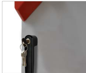
Serrure de porte