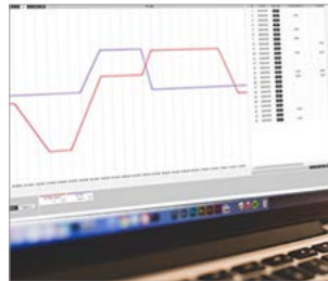
Multimanagement Software APT-COM™ 4