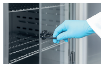
Porte vitrée intérieure