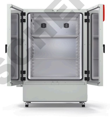
Modèle KBF-S ECO 720