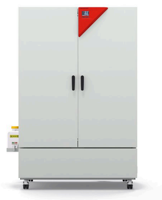
Modèle KBF-S ECO 720