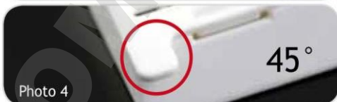
Foto 4: La linguetta di apertura non presenta spigoli vivi ed è strutturata in modo da consentire una facile apertura da parte dell'operatore.

L'area di scrittura anteriore ha un angolo di 45°.