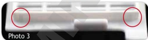
Photo 3: Moreover, the presence of special ribs located on the lid, prevents the forward movement thereof with respect to the body of the cassette, ensuring the insertion and sealing of the two rear hooks into the appropriate slits ( Photo 2 ), thus avoiding the opening of the cassette on the back.

Foto 3: Inoltre, la presenza di nervature speciali situate sul coperchio, impediscono il movimento in avanti della stessa rispetto al corpo della cassetta, garantendo l'inserimento e la sigillatura dei due ganci posteriori nelle appropriate fessure ( Foto 2 ), evitando così l'apertura della cassetta sul retro.