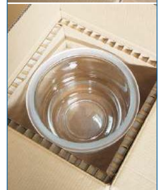
Reinforced box Caja reforzada Boîte renforcée

Les dessiccateurs NORMAX® sont marqués avec la marque Normax pour garantir leur authenticité.