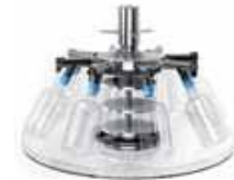
Bac de récolte du condensat