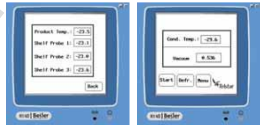
Écrans du panneau de contrôle du LyoQuest

L'appareil a été spécifiquement conçu pour les travaux courants de recherche dans les instituts scientifiques et de biotechnologie.