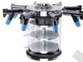
Chambre standard avec rampe à 8 prises