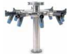
Rampe à 8 prises