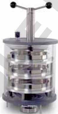
Chambre grande capacité avec système de bouchage