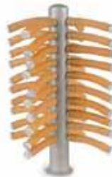
Rampe à 40 prises