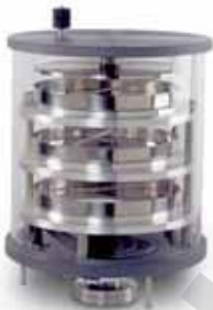
Chambre grande capacité