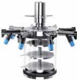
Chambre standard avec rampe à 8 prises et système de bouchage