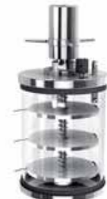
Chambre avec système de bouchage