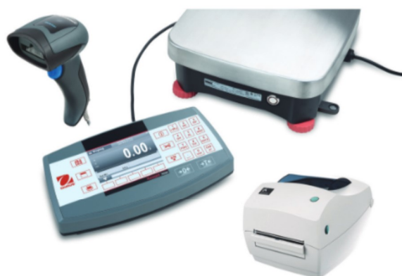
À des fins d'illustration uniquement