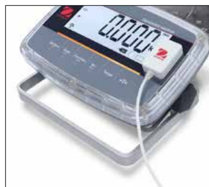
Kit RS232 IR en option pour le modèle i-D61PW