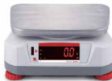
Afficheur arrière avec capteur sans contact intégré