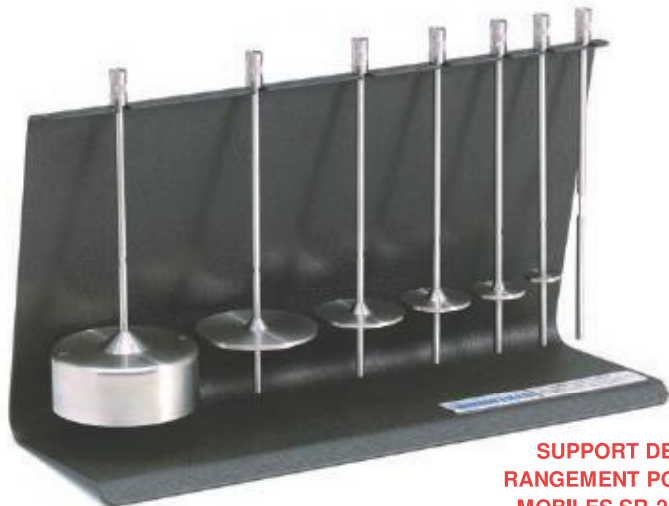
SUPPORT DE RANGEMENT POUR MOBILES SR-23Y

Le jeu de mobiles RV/HA/HB contient les mobiles #2 à #7 et est fourni avec les viscosimètres et rhéomètres Brookfield standard.