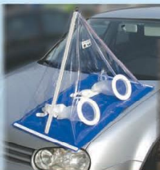
- sur une voiture.