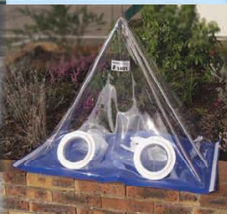
- sur un mur etc...