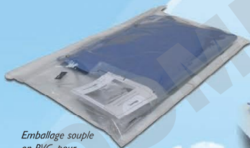
Emballage souple en PVC, pour un transport facile.