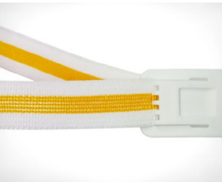
Brides extra longues et ajustables