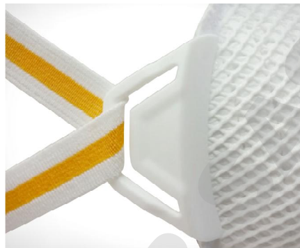
Brides coulissantes pour être mises et enlevées très facilement