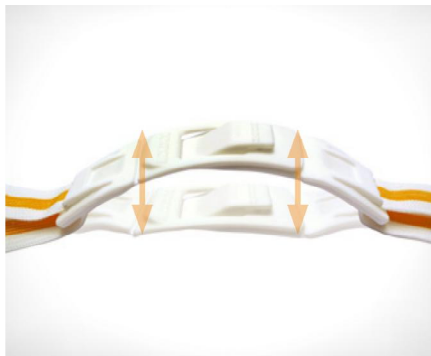
Clip d'attache souple pour plus de confort