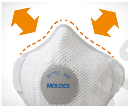
ActivForm® pas besoin de pince nasale