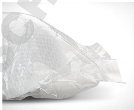
Emballage individuel hygiénique