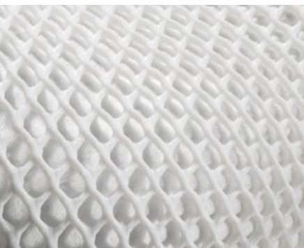
DuraMesh® Structure résistante qui garde le masque en forme