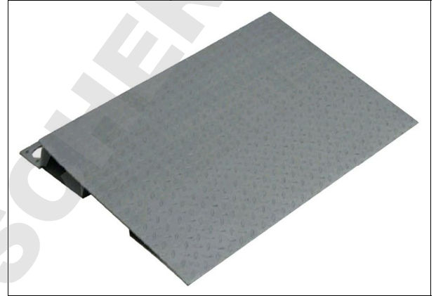
Option rampe de montée - 253768