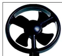
Hélice Ø 75 mm