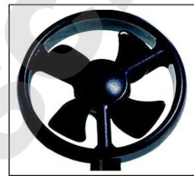
Hélice Ø 40mm