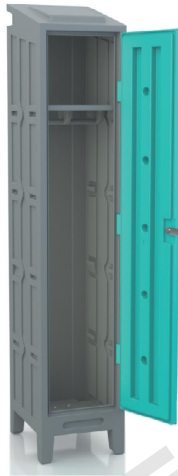
Casier vestiaire qualité alimentaire avec une étagère tringle