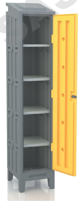
Casier vestiaire qualité alimentaire avec étagères simples