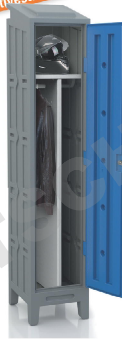
Casier vestiaire qualité alimentaire avec une étagère tringle + cloison réglable 3 points