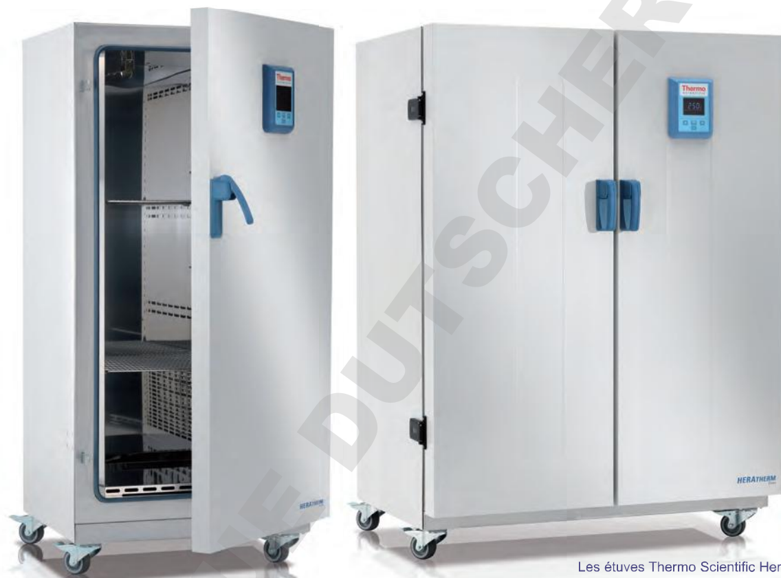
Les étuves Thermo Scientific Heratherm grande capacité sont disponibles en versions 400 L et 750 L

Les études Heratherm grande capacité ont été conçues pour répondre à votre besoin d'échantillons plus encombrants ou de volume d'échantillon élevé. Les étuves General Protocol offrent une grande capacité pour vos applications de séchage et de chauffage au quotidien.