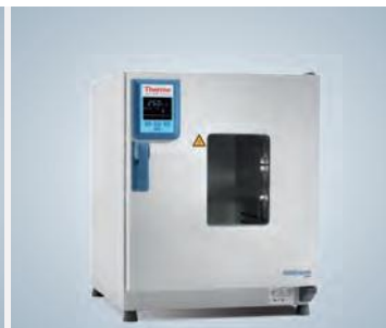
Fenêtre d'observation les appareil de 100 L