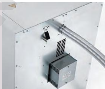
Kit d'installation sous pailasse