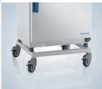
Piètement avec roulettes