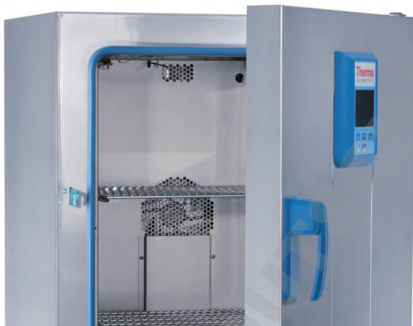
Modèle 100 L

Intégrant tous les avantages des étuves de paillasse General Protocol, la gamme Advanced Protocol est dotée de caractéristiques supplémentaires qui offrent davantage de souplesse, de précision et de fiabilité.