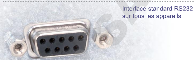
Interface standard RS232 sur tous les appareils

Le clapet d'air frais permet de contrôler les échanges d'air