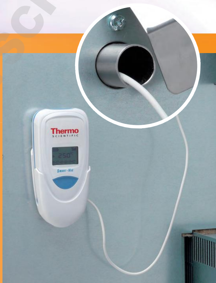
Vue arrière de l'étuve Advanced Protocol 100 L avec Smart-View

Les solutions varient selon les régions RF dans le monde entier et sont compatibles avec de nombreux types et marques d'équipements de laboratoire. Contactez votre représentant local pour de plus amples détails.