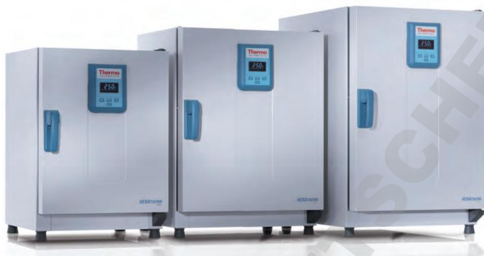
Modèles 60 L, 100 L, 180 L

Les étuves Heratherm ont une enceinte intérieure avec des coins arrondis faciles à nettoyer