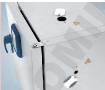
Port d'accès, face supérieure et côté droit

Contactez Thermo Fisher Scientific pour obtenir des renseignements sur nos solutions spéciales. Nous pouvons proposer les étuves de pailasse Heratherm pour des applications d'essai de câbles, des applications en salle blanche et des applications de gaz inerte avec enceinte intérieure étanche au gaz. Nous pouvons proposer des ports d'accès supplémentaires pour les étuves de grande capacité à l'emplacement souhaité, sur demande.