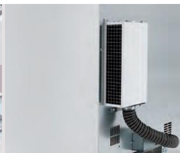
Filtre à particules