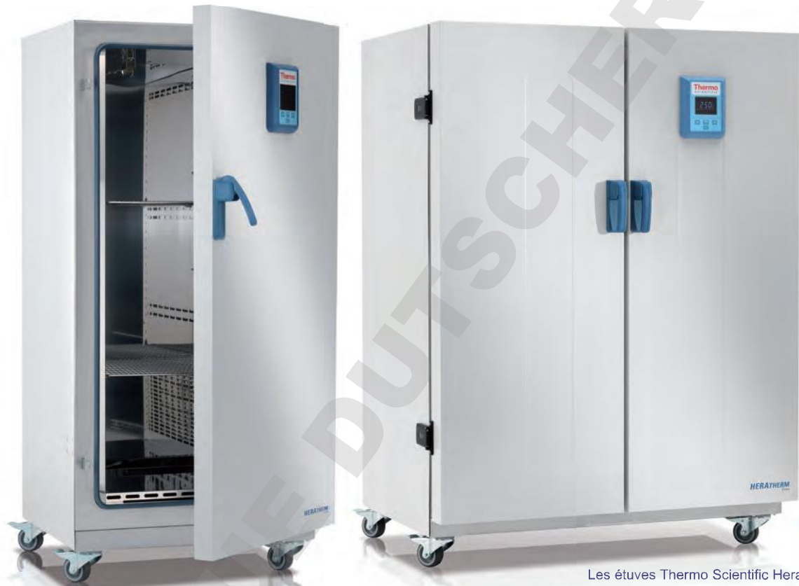
Les étuves Thermo Scientific Heratherm grande capacité sont disponibles en versions 400 L et 750 L

Les études Heratherm grande capacité ont été conçues pour répondre à votre besoin d'échantillons plus encombrants ou de volume d'échantillon élevé. Les étuves General Protocol offrent une grande capacité pour vos applications de séchage et de chauffage au quotidien.