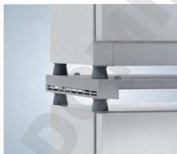
Kit de gerbage