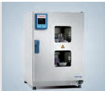
Fenêtre d'observation appareil de 180 L