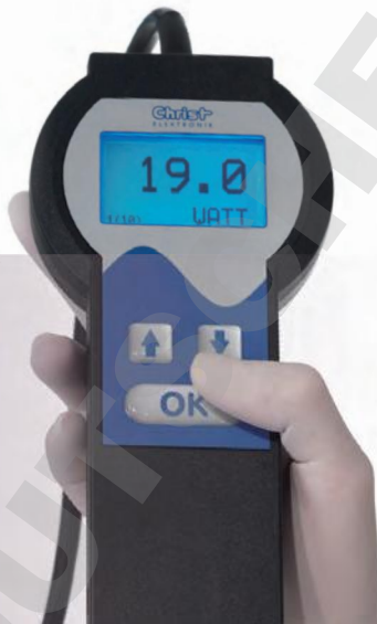
*d'après des tests réalisés en interne en avril 2012