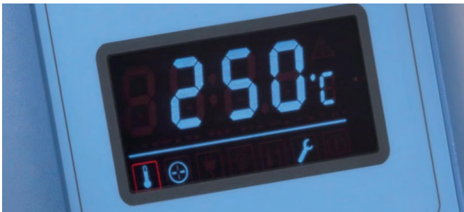
Affichage fluorescent à vide très lisible avec boutons tactiles simples à utiliser

Les étuves Thermo Scientific Heratherm grande capacité permettent de réaliser des économies d'énergie de 25 % par rapport aux étuves classiques*