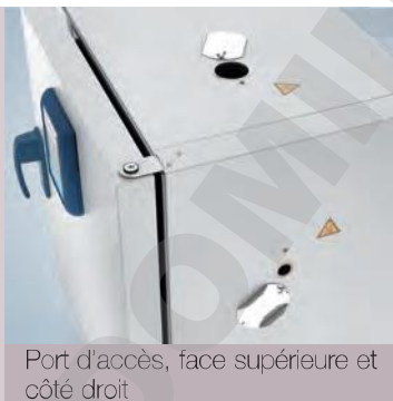
Port d'accès, face supérieure et côté droit

Contactez Thermo Fisher Scientific pour obtenir des renseignements sur nos solutions spéciales. Nous pouvons proposer les étuves de pailasse Heratherm pour des applications d'essai de câbles, des applications en salle blanche et des applications de gaz inerte avec enceinte intérieure étanche au gaz. Nous pouvons proposer des ports d'accès supplémentaires pour les étuves de grande capacité à l'emplacement souhaité, sur demande.