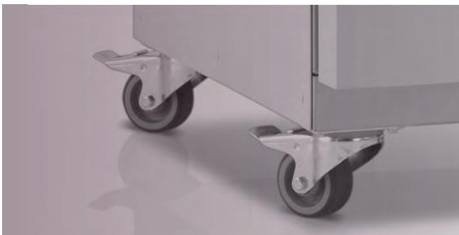
Les roulettes installées en usine permettent de déplacer et d'installer facilement l'appareil dans le laboratoire.

Les étuves Thermo Scientific Heratherm grande capacité permettent de réaliser des économies d'énergie de 25 % par rapport aux étuves classiques*