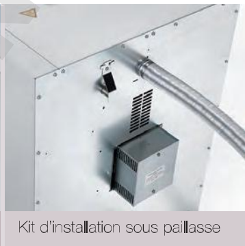
Kit d'installation sous pailasse