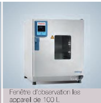
Fenêtre d'observation les appareil de 100 L