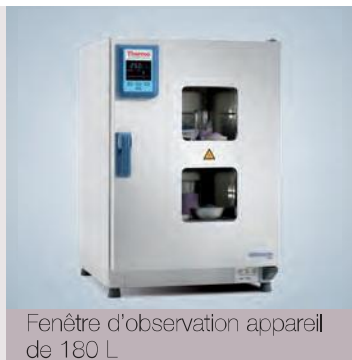
Fenêtre d'observation appareil de 180 L