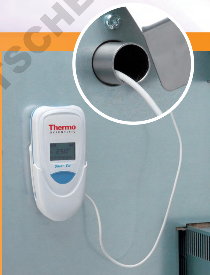
Vue arrière de l'étuve Advanced Protocol 100 L avec Smart-View

Les solutions varient selon les régions RF dans le monde entier et sont compatibles avec de nombreux types et marques d'équipements de laboratoire. Contactez votre représentant local pour de plus amples détails.