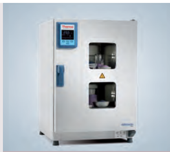
Fenêtre d'observation appareil de 180 L