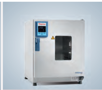
Fenêtre d'observation les appareil de 100 L