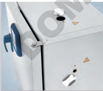
Port d'accès, face supérieure et côté droit

Contactez Thermo Fisher Scientific pour obtenir des renseignements sur nos solutions spéciales. Nous pouvons proposer les étuves de paillasse Heratherm pour des applications d'essai de câbles, des applications en salle blanche et des applications de gaz inerte avec enceinte intérieure étanche au gaz. Nous pouvons proposer des ports d'accès supplémentaires pour les étuves de grande capacité à l'emplacement souhaité, sur demande.