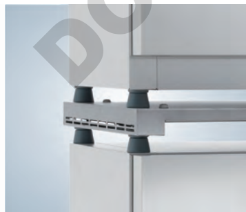
Kit de gerbage