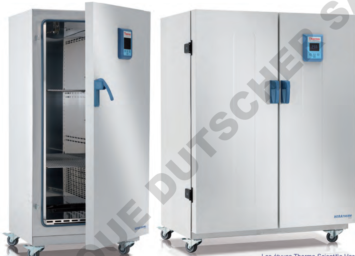
Les étuves Thermo Scientific Heratherm grande capacité sont disponibles en versions 400 L et 750 L

Les études Heratherm grande capacité ont été conçues pour répondre à votre besoin d'échantillons plus encombrants ou de volume d'échantillon élevé. Les étuves General Protocol offrent une grande capacité pour vos applications de séchage et de chauffage au quotidien.