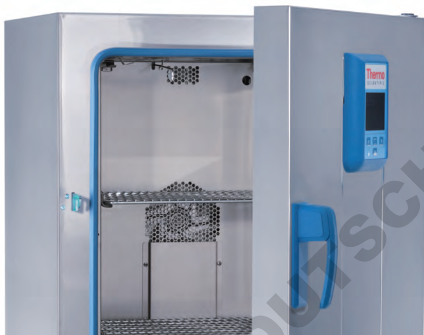
Modèle 100 L

Intégrant tous les avantages des étuves de paillasse General Protocol, la gamme Advanced Protocol est dotée de caractéristiques supplémentaires qui offrent davantage de souplesse, de précision et de fiabilité.