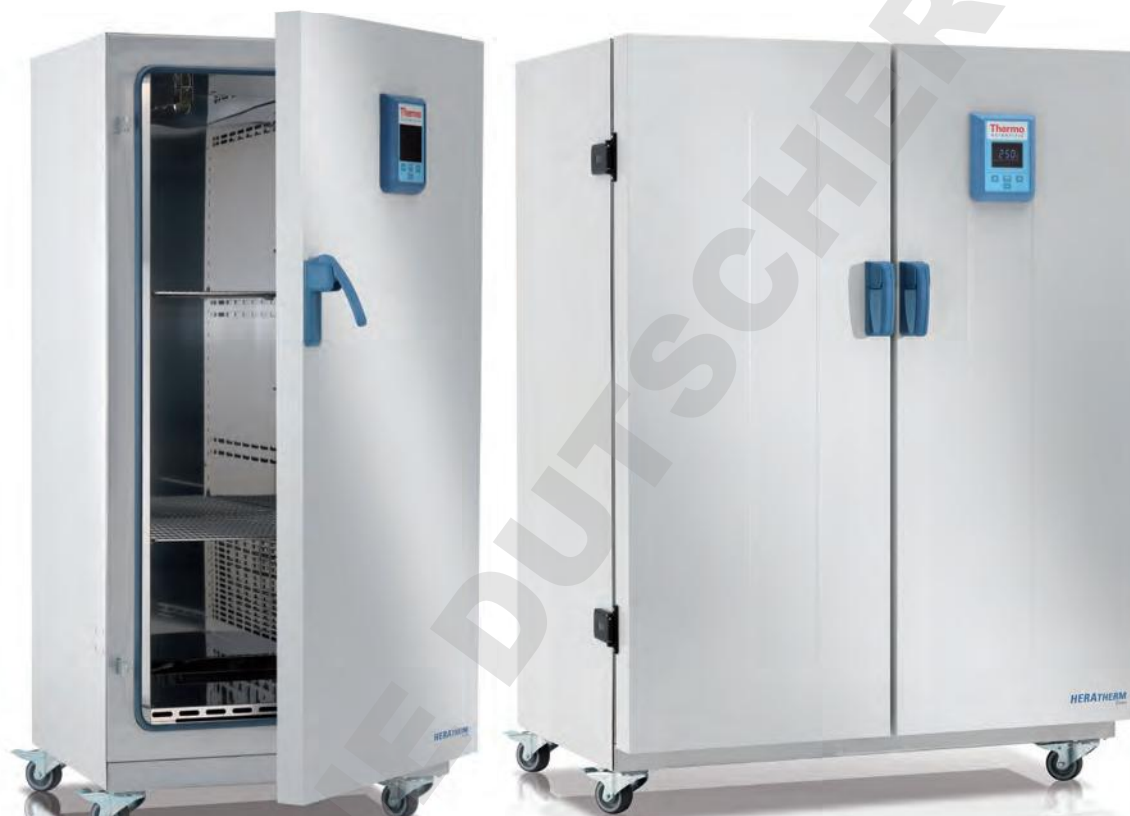
Les étuves Thermo Scientific Heratherm grande capacité sont disponibles en versions 400 L et 750 L

Les études Heratherm grande capacité ont été conçues pour répondre à votre besoin d'échantillons plus encombrants ou de volume d'échantillon élevé. Les étuves General Protocol offrent une grande capacité pour vos applications de séchage et de chauffage au quotidien.