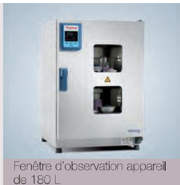
Fenêtre d'observation appareil de 180 L