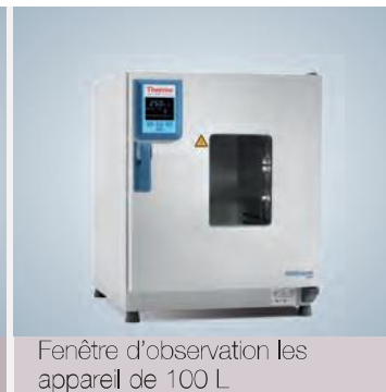
Fenêtre d'observation les appareil de 100 L